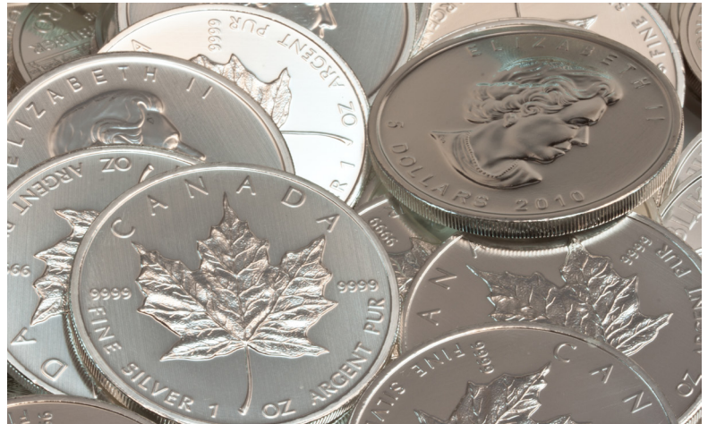
Physische Edelmetalle, wie z.B. Silbermünzen, sind ein optimaler Inflationsschutz

Die Stabilitas GmbH ist spezialisiert auf die Beratung von Mineninvestments. Die unabhängige Investmentboutique wurde im Jahr 2005 unter dem Namen ERA Resources gegründet und legt den Schwerpunkt der Beratung auf Edelmetallfonds mit unterschiedlichen regionalen und inhaltlichen Ausrichtungen.